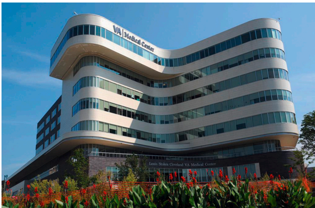
Rycina. Centrum Medyczne VA im. Louisa Stokesa w Cleveland, Ohio Figure. Louis Stokes Cleveland VA Medical Center, University Circle, Cleveland, Ohio

środowiska, z którego pochodzi pacjent, związane jest z podejściem ekologicznym, które jest podstawą wykształcenia zawodowego pracowników socjalnych [1,2].